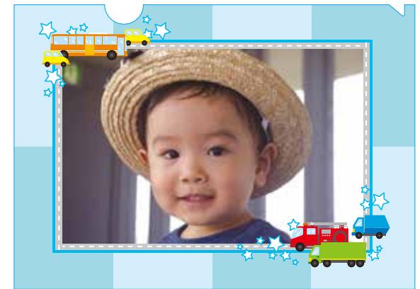
画素数が適正の場合（600 万画素～）